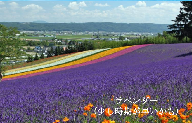
ラベンダー (少し時期が早いかも)